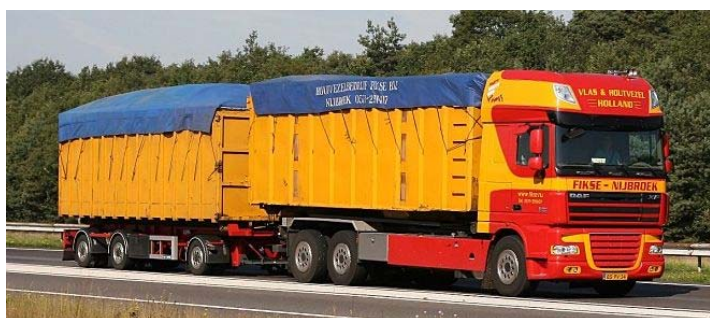
De combinatie van Fikse Houtvezels B.V.

Daar aangekomen werd de lading op een groot aantal adressen gelost. Er was onder meer een grote hoeveelheid meubilair aan boord voor de inrichting van het nieuwe dorps-huis in Rosia. Een grote leegstaande koeienschuur werd daar in 2012 en het voorjaar 2013 helemaal omgebouwd tot "Casa Cultura".