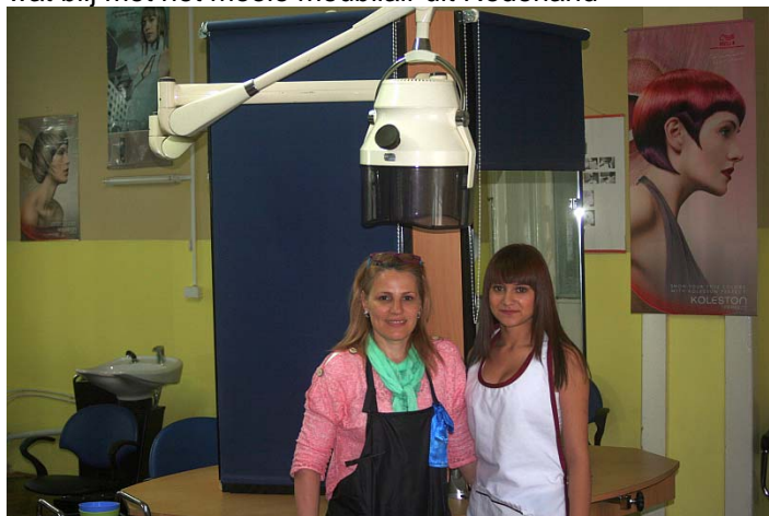
Inventaris van de kappersopleiding ROC Aventus in Sibiu in gebruik

Inmiddels is alles in Sibiu geïnstalleerd en in gebruik genomen. De leerkrachten en ook de leerlingen zijn maar wat blij met het mooie meubilair uit Nederland