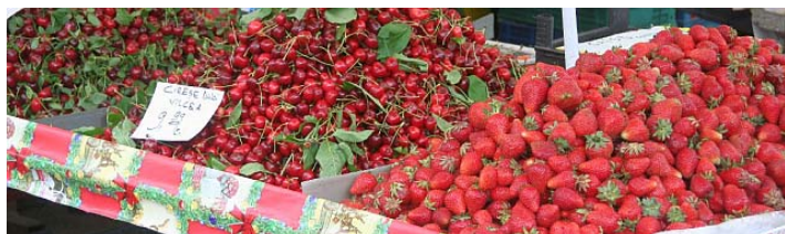
Op de markt in Sibiu: aardbeien en kersen

De directie van Verkeersschool De Weerd heeft ons al laten weten dat er in het najaar opnieuw twee vrachtwagencombinaties naar Sibiu zullen vertrekken. Grote klasse!