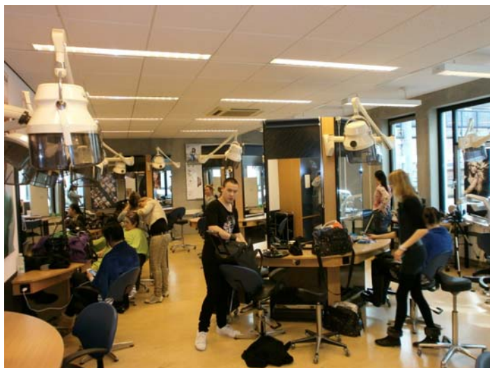
Kappersopleiding in Deventer

Die was in Roemenië vrij snel gevonden bij de kappersopleiding, een school voor voortgezet onderwijs in Sibiu.