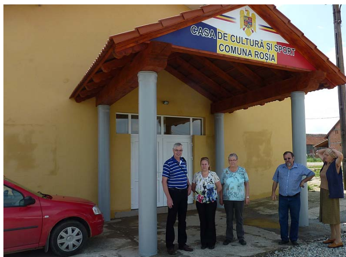
De ingang van het Casa Cultura in Rosia

Het "casa cultura" in Rosia biedt plaats aan een groot aantal bezoekers. Op de foto een overzicht van de opening op 12 mei.