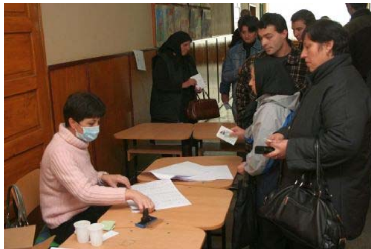
Registratie voor de uitreiking van de pakketten, november 2009

De automatische incasso zal deze keer in de tweede week van maart worden verwerkt, waarna het bedrag van uw rekening zal worden afgeschreven. Indien u zelf uw betaling wilt verzorgen dan verzoeken wij u dit te doen voor 20 maart 2010 onder vermelding van het ID.-nummer van uw Roemeense gezin. U wordt nogmaals dringend verzocht bij handmatig geschreven bankopdrachten duidelijk het ID. nummer (doosnummer) te vermelden, dit voorkomt veel zoekwerk.