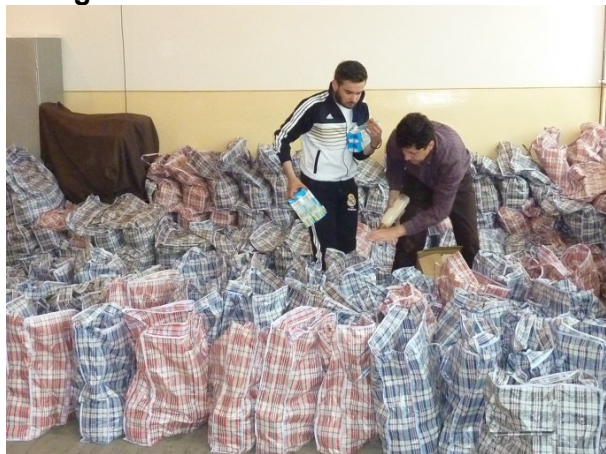
De tassen staan gereed om uitgereikt te worden